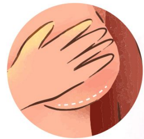
Terjadi perubahan bentuk, tergantung dari seberapa banyak jaringan diambil

*Hubungi breast care nurse kami di 0811-1990-3792 , jika punya pertanyaan seputar kanker payudara.