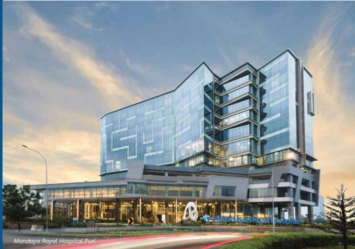
Mandaya Royal Hospital Puri